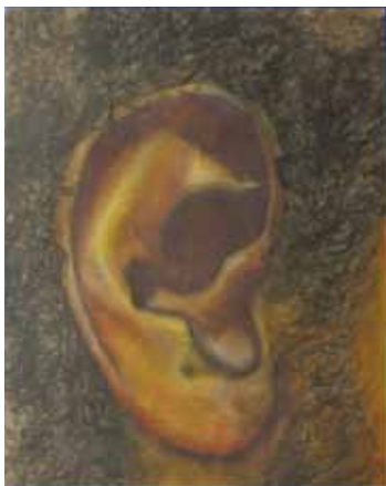
“Detalle César” Tiza pastel sobre papel

Dibujo desde que tengo conciencia y nunca lo he dejado, He ido desde el dibujo estilo manga, pasado por bodegón hasta llegar a asentarme con la técnica de dibujo figurativo en tizas pastel