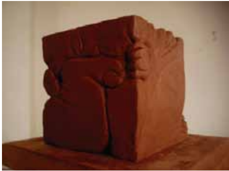
“Planificación Social” Escultura en arcilla de 12 x 12 cm

Cuando descubrí que la escultura tiene infinidad de técnicas y materiales tomé la decisión de elegirla como mi especialidad al graduarme de la escuela de artes visuales.