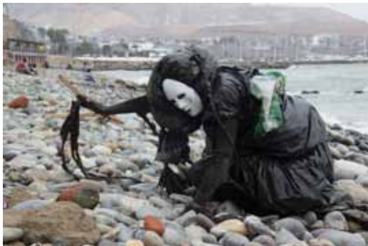
““El mito de Quiyak”” Diseño de vestuario e intervención de espacio

Cuando descubrí que la escultura tiene infinidad de técnicas y materiales tomé la decisión de elegirla como mi especialidad al graduarme de la escuela de artes visuales.