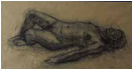
“Retrato” Carboncillo sobre papel

Dibujo desde que tengo conciencia y nunca lo he dejado, He ido desde el dibujo estilo manga, pasado por bodegón hasta llegar a asentarme con la técnica de dibujo figurativo en tizas pastel